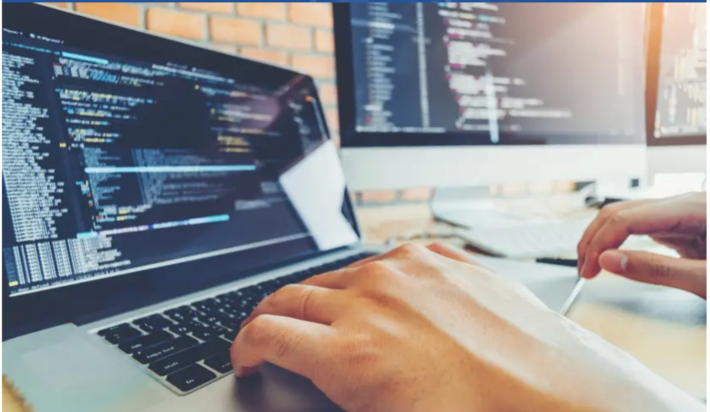
בניית אתרים לחברות